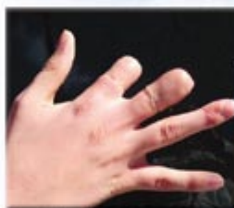
csuk kezelő szilikon próbatok